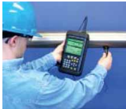
Дополнительный датчик для измерения толщины стенки трубы

Экономическая эффективность портативного расходомера определяется как параметрами самого расходомера, так и возможностью его использования в полевых условиях. Надежность конструкции и исполнения расходомера PT878GC гарантирует долговременную стабильность его характеристик и, таким образом, длительное время эксплуатации, снижая затраты на простой оборудования и практически не требуя технического обслуживания прибора.