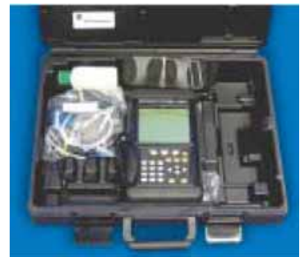
Расходомер PT878GC в кейсе для переноски

Новый прибор прошел большой объем испытаний на металлических трубах, содержащих воздух, водород, природный газ и другие газы в широком диапазоне диаметров труб – от 4 до 24 дюймов. Использование запатентованной времяимпульсной корреляционной технологии детектирования позволило получить очень высокую точность измерения – относительная погрешность менее \pm 2\% при воспроизводимости \pm 0,5\% .