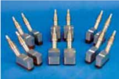
Накладные ультразвуковые преобразователи для газов, изготовленные по новой технологии компании GE Panametrics

Один из самых больших «камней преткновения» применения накладных ультразвуковых преобразователей для измерения расхода газа является трудность передачи кодированного ультразвукового сигнала: через стенку металлической трубы, через газ и затем обратно через стенку трубы ко второму преобразователю, принимающему этот сигнал. В газах только 4,9 \times 10^{-7} процента передаваемой звуковой энергии реально принимается традиционными ультразвуковыми преобразователями. Этого просто недостаточно для выполнения надежных измерений.